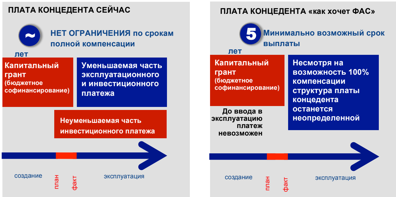
Рис. 1. Сравнение существующей и предлагаемой ФАС России моделей выплаты платы концедента

Следует отметить, что исключение слова «часть» из указанных выше законодательных положений действительно разрешит вопрос о возможности полного финансирования концедентом создания, реконструкции, эксплуатации объекта.