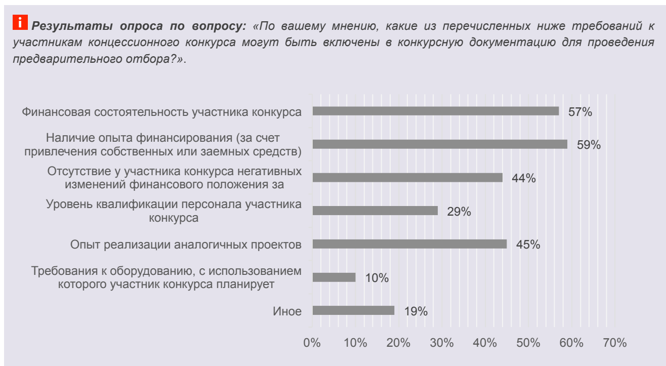
Рис. 3 Результаты опроса

Фактически финансовые показатели деятельности инвестора вытеснили на второй план иные возможные требования к реализации проектов и промежуточные результаты опроса не вызывают удивление. Указанное также свидетельствует о том,